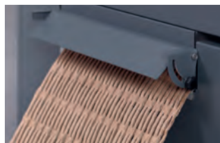
Mata wyścielająca wytworzona z 1 warstwy kartonu (HSM ProfiPack P425).