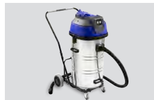
Wyposażenie dodatkowe: system odpylający (HSM ProfiPack P425)