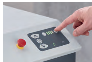
Regulacja prędkości podawania materiału