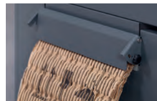
2-warstwowy materiał wypełniający otrzymany po zamknięciu klapki kompresującej (HSM ProfiPack P425).